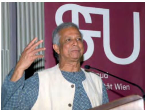
Muhammad Yunus , Nobelpreisträger 2006

Die SFU bietet in den ersten zwei Juliwochen den Studierenden die Möglichkeit, die Ferienzeit zur Weiterbildung und Vertiefung zu nutzen. Die zweiwöchige Summer School verbindet Vorträge über unterschiedliche Therapieschulen und Schwerpunkte mit ausführlichen Diskussion und psychotherapeutischen Selbst- und Gruppenreflexionen. Die Research Summer School vertieft eine Woche lang das Forschungswissen der zukünftigen PsychotherapeutenInnen.