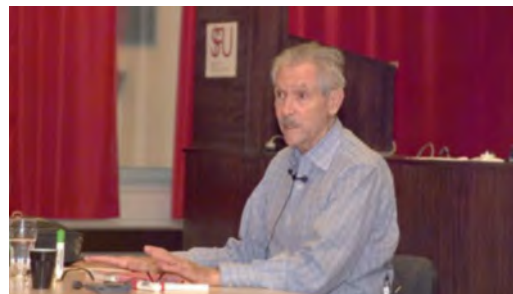
Daniel Stern , Psychoanalytiker, Schwerpunkt Säuglingsforschung