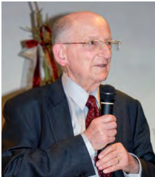
Otto F. Kernberg Ehemaliger Präsident der Internationalen Psychoanalytischen Vereinigung, Im Juni 2012 an der SFU

Die SFU bietet in den ersten zwei Juliwochen den Studierenden die Möglichkeit, die Ferienzeit zur Weiterbildung und Vertiefung zu nutzen. Die zweiwöchige Summer School verbindet Vorträge über unterschiedliche Therapieschulen und Schwerpunkte mit ausführlichen Diskussion und psychotherapeutischen Selbst- und Gruppenreflexionen. Die Research Summer School vertieft eine Woche lang das Forschungswissen der zukünftigen PsychotherapeutenInnen.