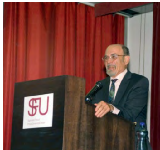
Irvin Yalom , Emeritierter Professor für Psychiatrie, Psychoanalytiker, Autor